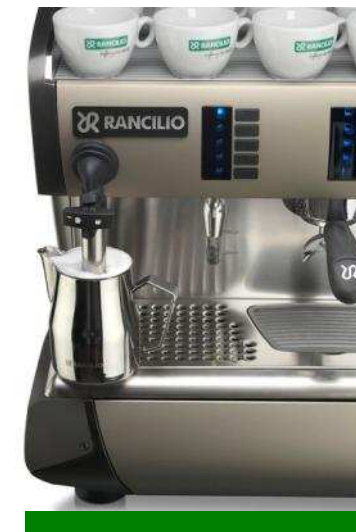
Intelligente Luftinjektion und leichte Reinigung